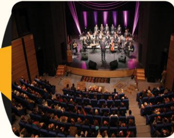
حفل فرقة بيت الرواد في مركز الحسين الثقافي