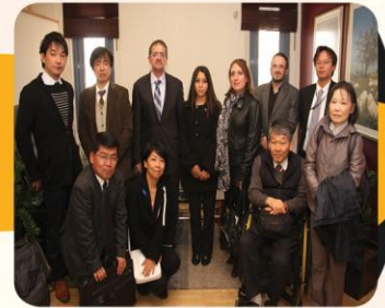
وفد ياباني من ( جايبكا ) يزور امانة عمان