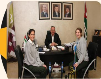
عنايبشيد بمقترح لطالبتين لمساعدة عمال النظافة