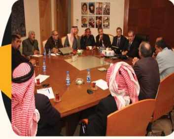
الكيلاي: رقابة الأمانة على القلابات تنظيمية وحفاظا على بيئة المدينة