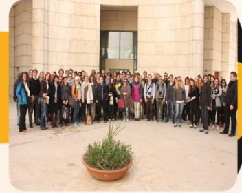
وفد طلابي نمساوي يطلع على مشاريع الأمانة المعمارية